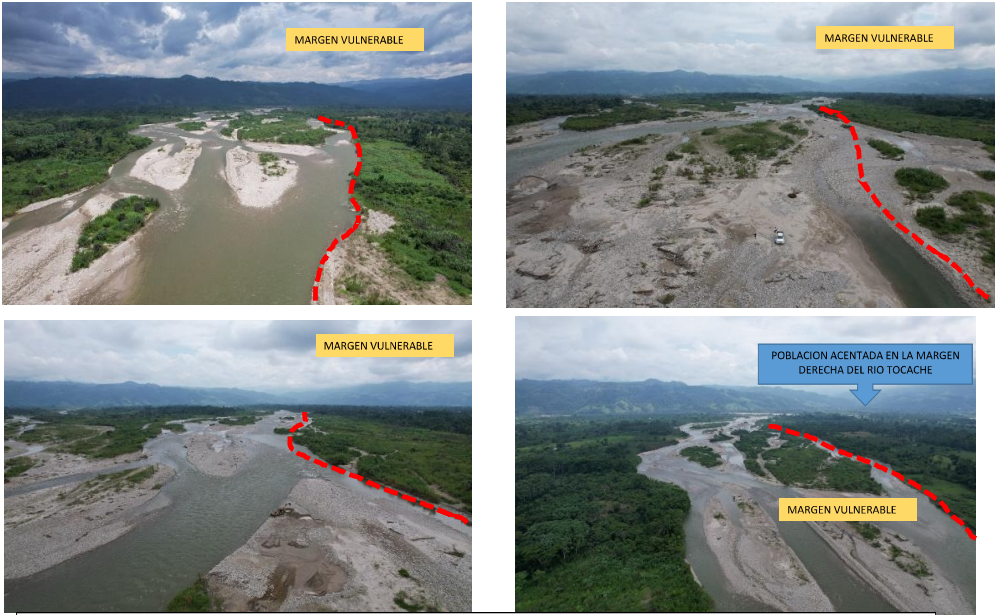
IMAGENES AEREAS DEL AREA VULNERABLE A INUNDACIONES, SE PERCIBE ISLOTES DE MATERIAL COLMATADO QUE DESVIAN EL CAUCE DEL RIO TOCACHE HACIA LA MARGEN DERECHA, PONIENDO EN RIESGO A VIVIENDAS, VIDAS HUMANAS, AREAS DE CULTIVOS, SERVICIOS BASICOS.